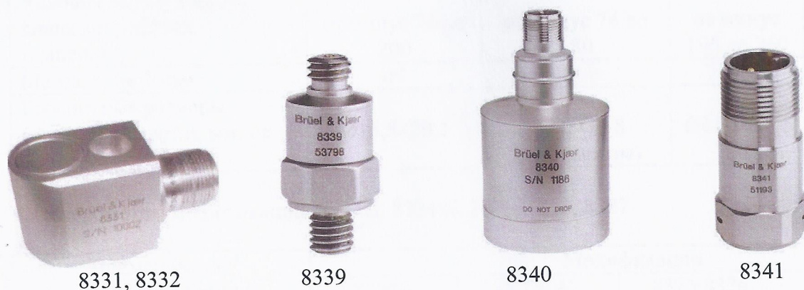
Рисунок 1 - Внешний вид акселерометров серии 8300