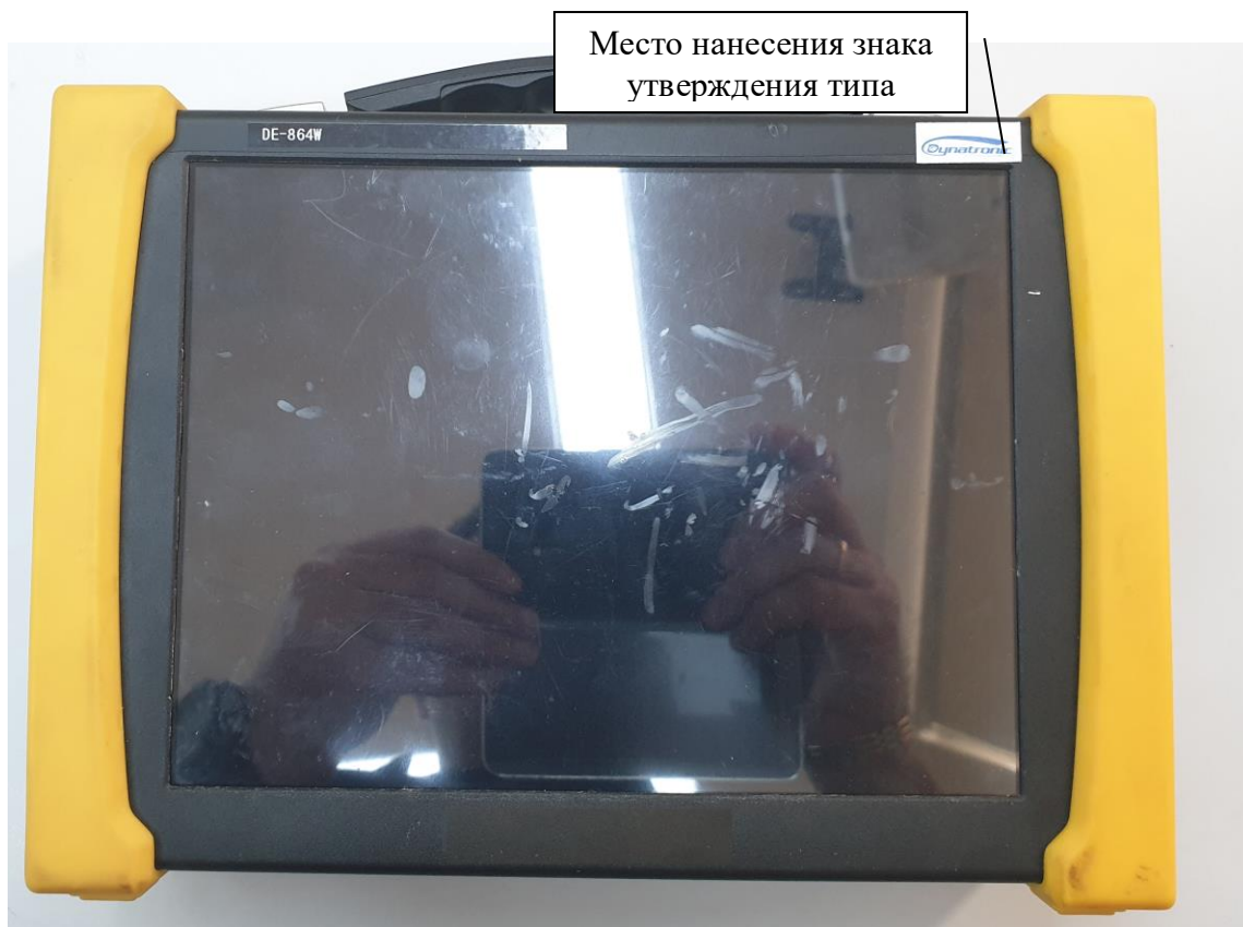
Рисунок 2 – Общий вид анализаторов вибрации модификации DE-864W